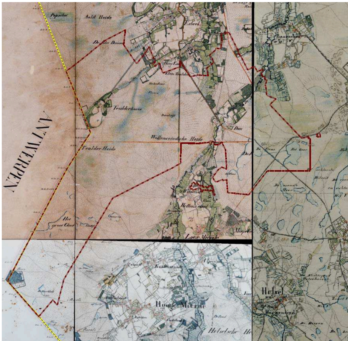
De huidige begrenzing van De Utrecht is getekend op de Topografische kaart 1836-1843, bladen 179C, 179D, 180C en 189B.

De Utrecht is een ontginningslandgoed dat is ontstaan door het ontginnen van heide grond. Het doel hiervan was het tot stand brengen van akkergronden en productiebossen. Rond 1850 bestond het gebied uit uitgestrekte heidevelden, in feite gedegraderd bos met name als gevolg van houtkap en overbeweiding. Uit de Topografische en Militaire Kaart van circa 1850 blijkt dat het gedeeltelijk om natte heide ging; in het gebied liggen verschillende vennen en vennetjes. Na de uitvinding van de kunstmest aan het eind van de negentiende eeuw werden schapen overbodig als leverancier van dierlijke mest, en daarmee de heide als graasgrond. Grootschaliger dan voorheen werden de heidevelden ontgonnen. De droge heide werd bebost en de vochtige heide omgezet in cultuurgrond: dit zijn de zogenaamde 'jonge heideontginningen'. Binnen het gebied lagen de oude, middeleeuwse ontginningen Dun, Tulder en Lange Gracht. Vooral de geschiedenis van Tulder of Teulder gaat ver terug: rond 1400 waren hier al percelen in cultuur gebracht en ontstond er een pleisterplaats met een bierbrouwerij en jeneverstokerij. Bij de ontginning van het landgoed zijn deze buurtschappen met hun akkercomplexen grotendeels bebost.