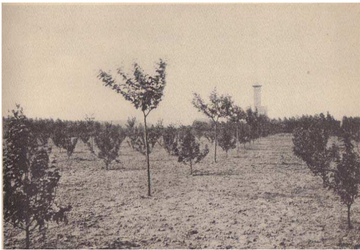
De jonge bomenaanplant met in de verte de brandtoren.